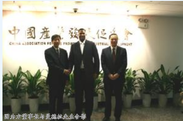
图为方董事长与曼德拉先生合影

本报讯(通讯员 赵森林)3月16日,集团董事长方朝阳在中国产业发展促进会上与南非前总统曼德拉亲切会面,并实地考察08年奥运会主体育场“鸟巢”。