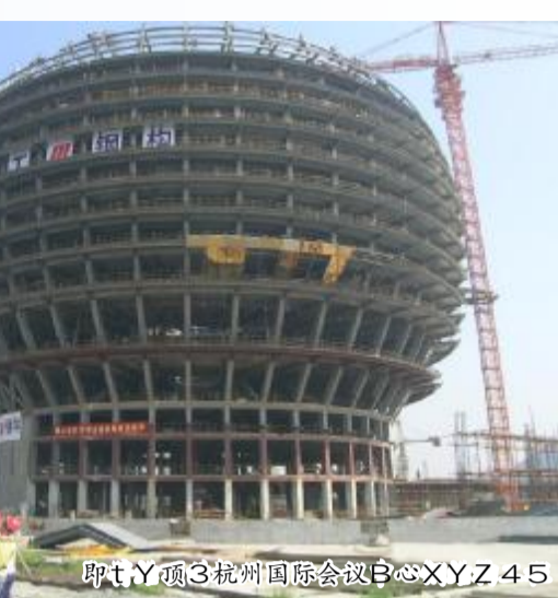
即Y顶3杭州国际会议中心XYZ45

烈日下许多人仍坚持在户外作业？可曾想到过许多工人正在烈日暴晒下挥汗如雨？可曾想到他们为了城市的正常运转，为了扮靓我们的生存环境，正在默默无闻地用辛勤的汗水装扮城市？这真是：“赤日炎炎威欲燃，黝躯半裸苦熬煎。功成隐忍何须赞，魂撑广厦掣云天”。我想城市是不会忘记他们的，他们是美丽城市的奠基人，他们是当代最可爱的人。从建筑工人们一道道坚强的目光里，我看到了未来，看到了我们城市的未来，甚至看到了建成后的杭州国际会议中心和杭州大剧院构成“日月同辉”的壮丽景观。