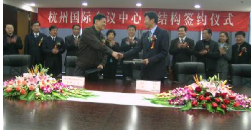
签约仪式在钱江新城管委会举行。